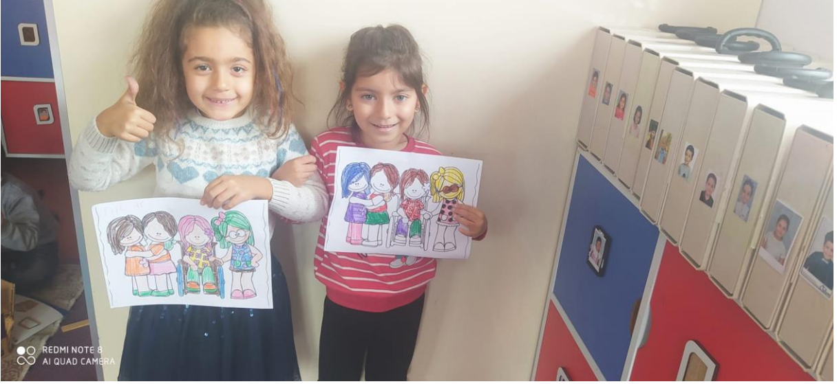
YARDIMLAŞMA BOYAMA SAYFALARI