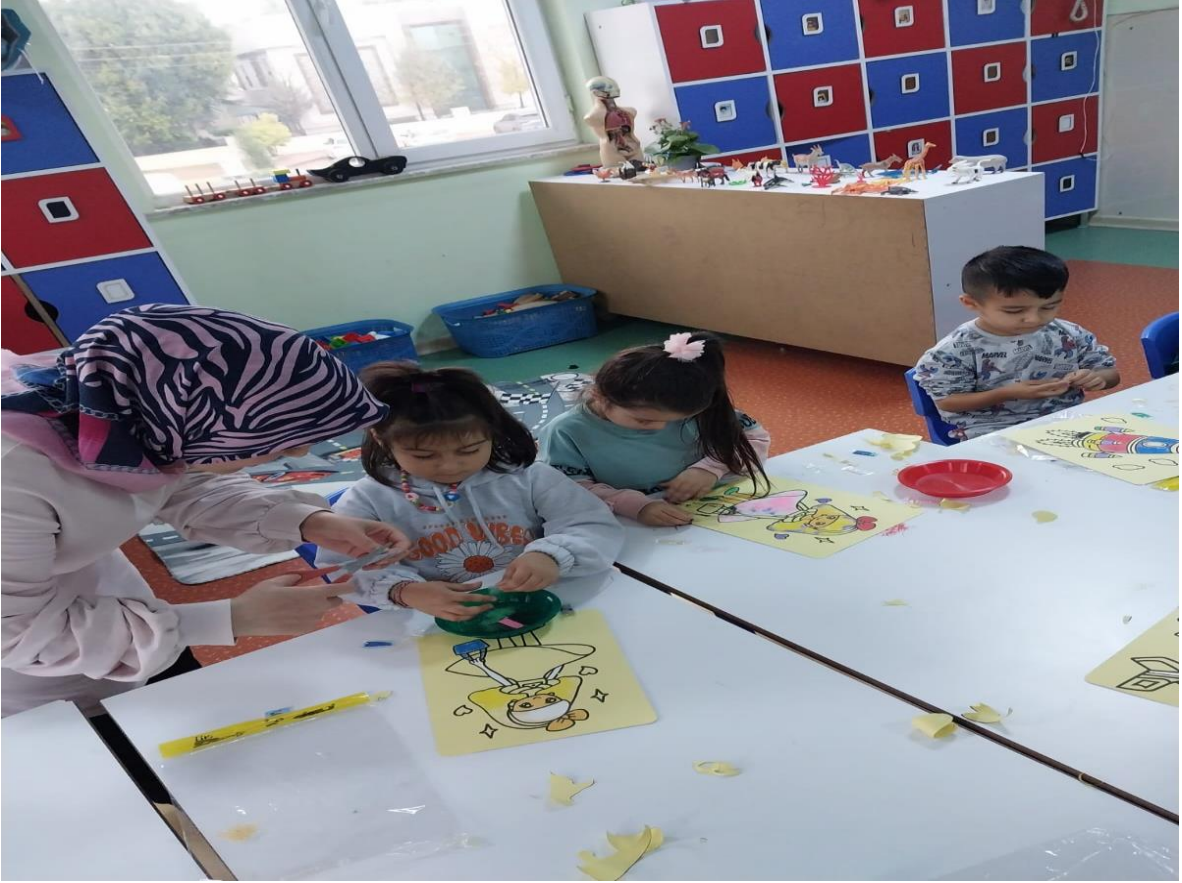
AİLE KATILIMDA VELİ YARDIMLARI