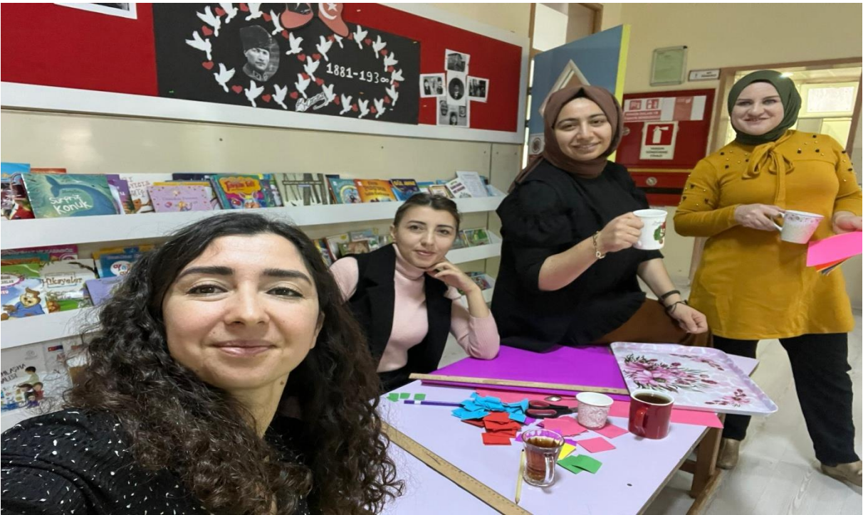
ÖĞRETMENLERİMİZİN YARDIMLAŞMALI PANOSU