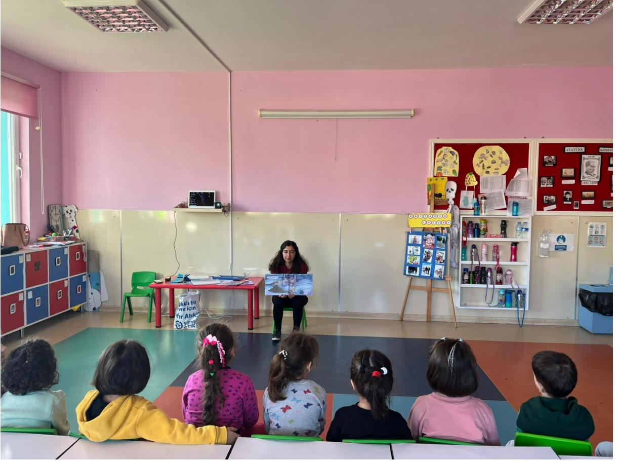
YARDIMLAŞMA İLE İLGİLİ HİKAYE ANLATIMI